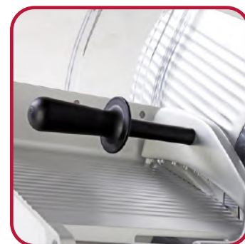
Pressamerce in lega di alluminio anodizzato. Food-holder arm in anodized aluminium.