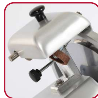
Affilatoio fisso. Fixed sharpener.